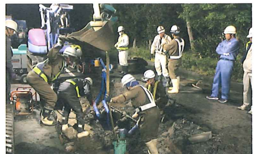
熊本地震の復旧活動の様子

東日本大震災では被災地からの要請を受け、1都14道県支部の協同組合から述べ5万人超を派遣して復旧作業に当たり、延べ日数は3,700日を超えました。また、熊本地震では、熊本県連の会員企業が全力で復旧工事に従事するとともに、厚生労働省及び各地の水道事業者の要請を受け、述べ約5,000名(熊本県外分)が現地に赴きました。